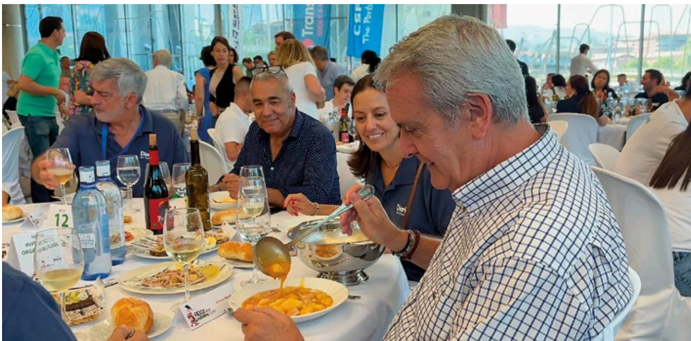
► El atractivo gastronómico de la Fiesta se construyó sobre el popular marmitako.