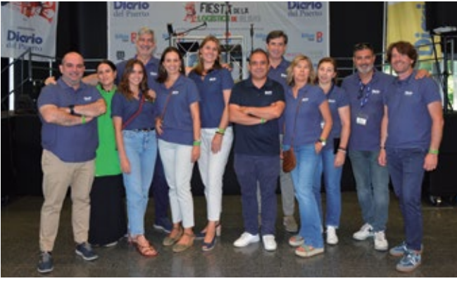
DIARIO DEL PUERTO.