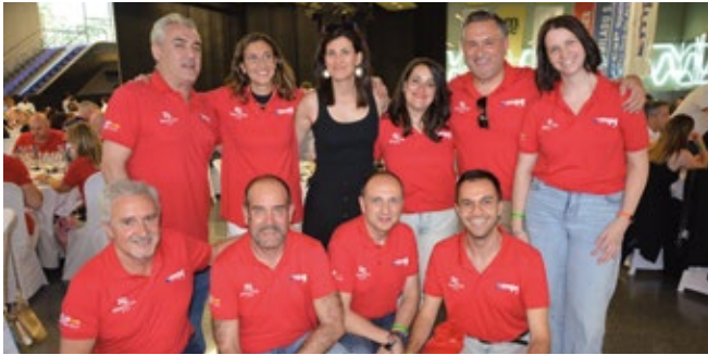
GRUPO PÉREZ Y CÍA. - MPG.