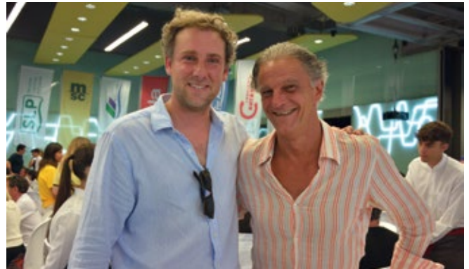
COMODALITY Y GRIMALDI.