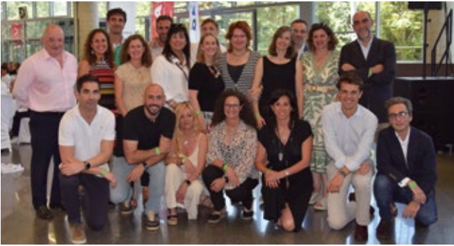
CONSIGNACIONES TORO Y BETOLAZA.