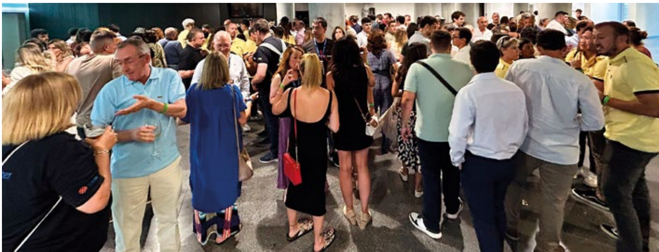
► El pasado año, antes del almuerzo, los participantes tuvieron ocasión de degustar unos pintxos.

de muselina de jamón, tosta de piquillos con hongos) y... pochas con txistorra, además de panxqueta con nata y crema, café, infusiones, agua, vino, txacolí y sidra.