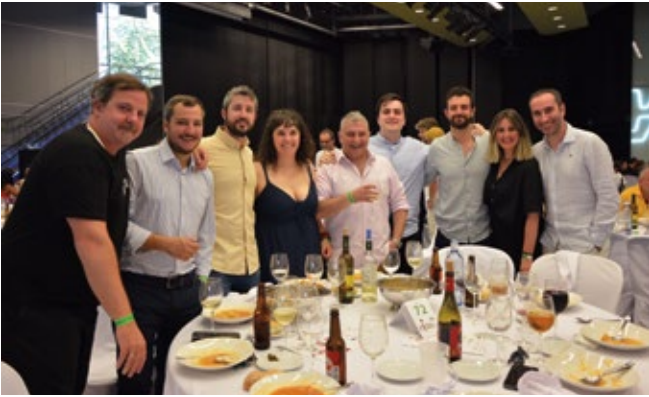
DSV AIR AND SEA.