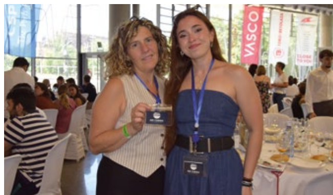
AM CARGO SHIPPING.