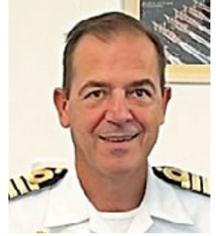
TOMÁS GARCÍA-FIGUERAS COMANDANTE NAVAL DE BILBAO