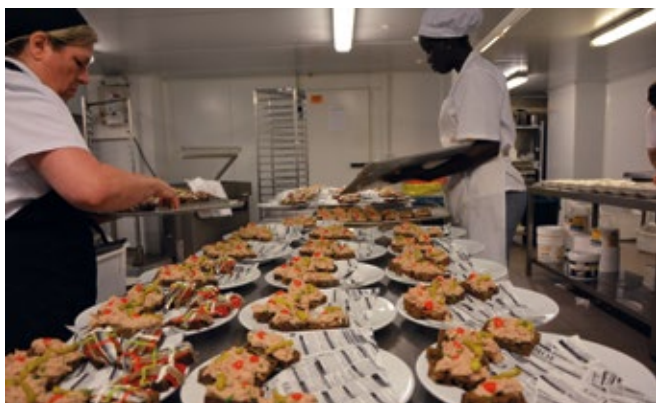
► Marmitako, pintxos, música y buen ambiente, los ingredientes del éxito de la Fiesta de la Logística de Bilbao.