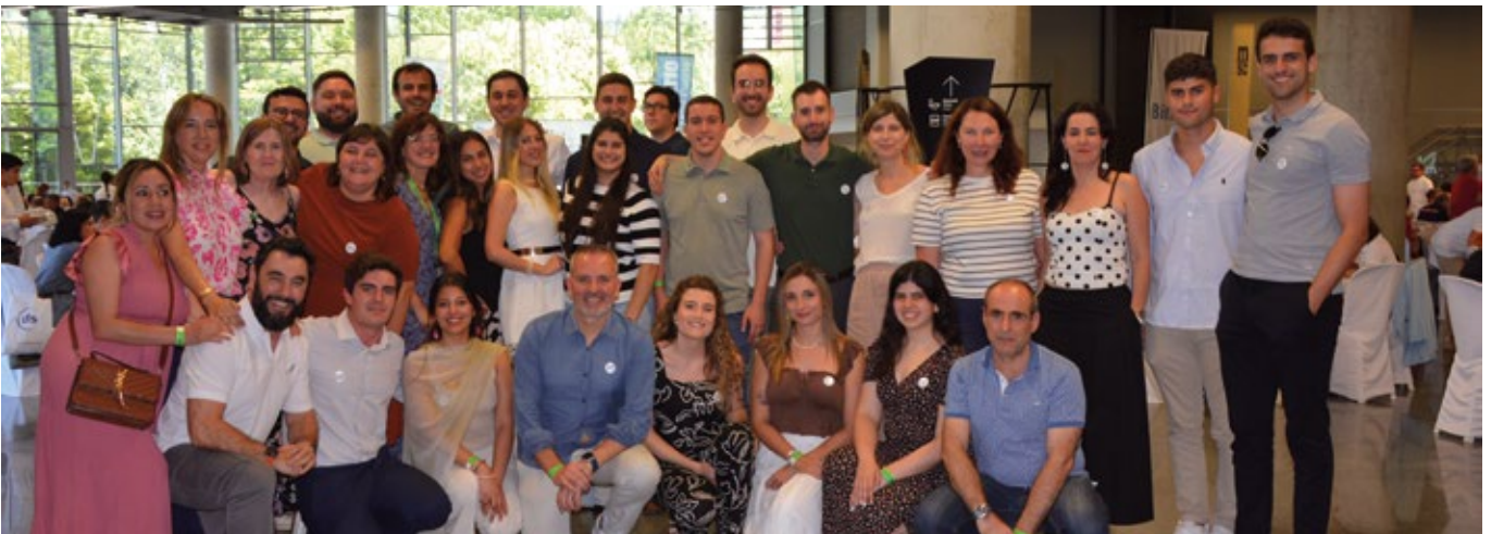
CMA CGM INLAND SERVICES SPAIN.