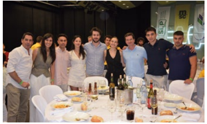
DSV AIR AND SEA.