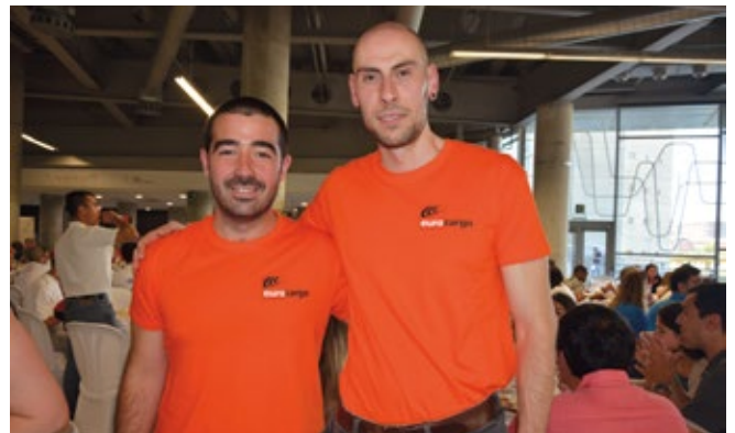
EURO CARGO EXPRESS.