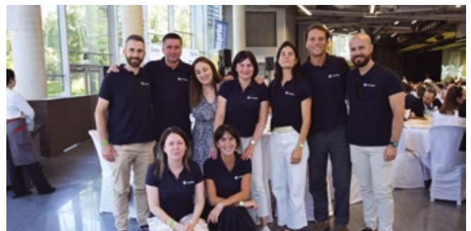
MAERSK PROJECT LOGISTICS.