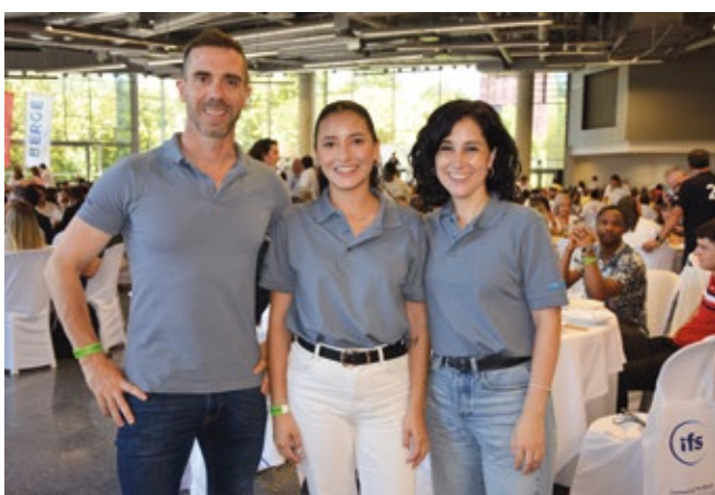
STINNES-MACS AGENCIA MARÍTIMA.