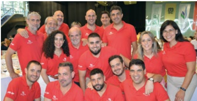
PÉREZ Y CÍA..