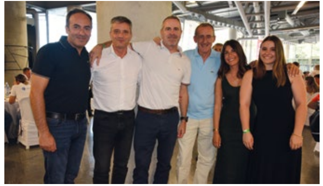
CEMASA, FRACHT PROJECT, EIMAR, GLOBAL CARGO.