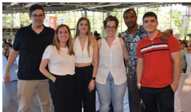
FR. MEYERS SOHN.