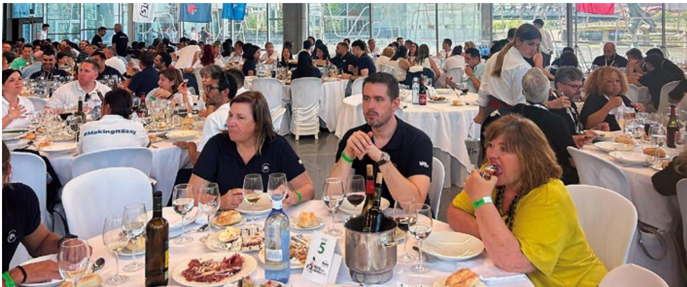
► Más de 1.000 profesionales demostraron el espíritu de unión de la comunidad logístico-portuaria de Bilbao.