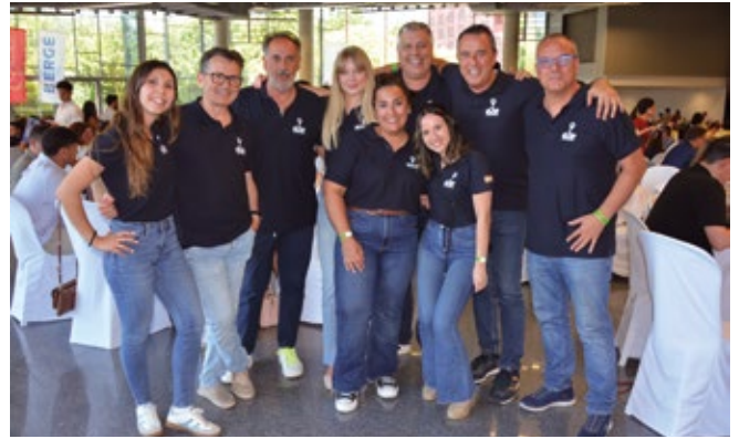
EZE LOGISTICS SOLUTIONS NORTE.