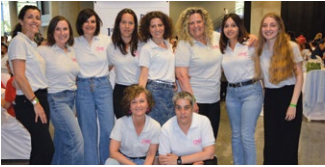
OCEAN NETWORK EXPRESS (ONE).