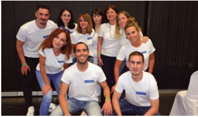
C.H. ROBINSON EUROPE B.V. (BILBAO BRANCH).