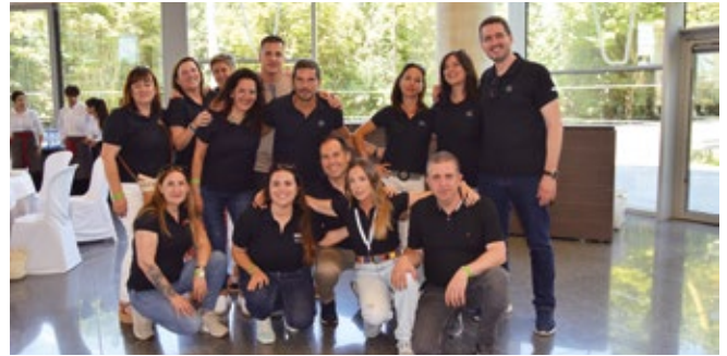
IFS - STOCK CARGO.