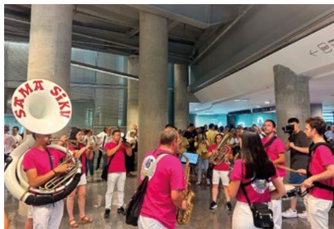
► La 1ª Fiesta de la Logística de Bilbao tuvo numerosos alicientes como la fanfarre santutxutarra Sama Siku que amenizó el inicio de la Fiesta.

Lo que aportan estos eventos se concreta en cada una de las Fiestas de la Logísticas que organiza Diario del Puerto. En la de Bilbao... lo mismo... pero más.