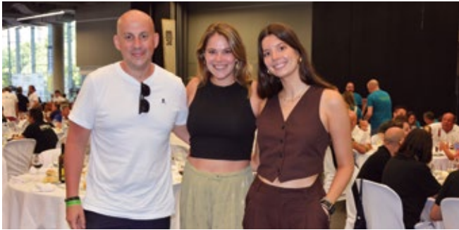
GMR GLOBAL TRANS.