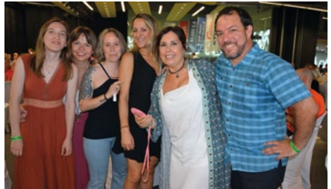
DHL, MATRANSA, GREEN IBÉRICA.