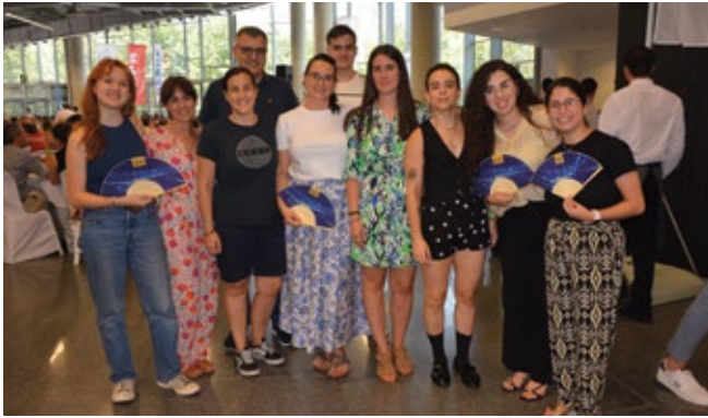
DACHSER BILBAO ASL.