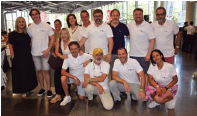
ABRA TRUCK LOGISTICS.