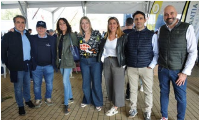
AUTORIDAD PORTUARIA DE VALENCIA.