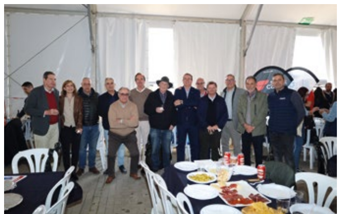
CONSEJO GENERAL DE AGENTES DE ADUANAS.