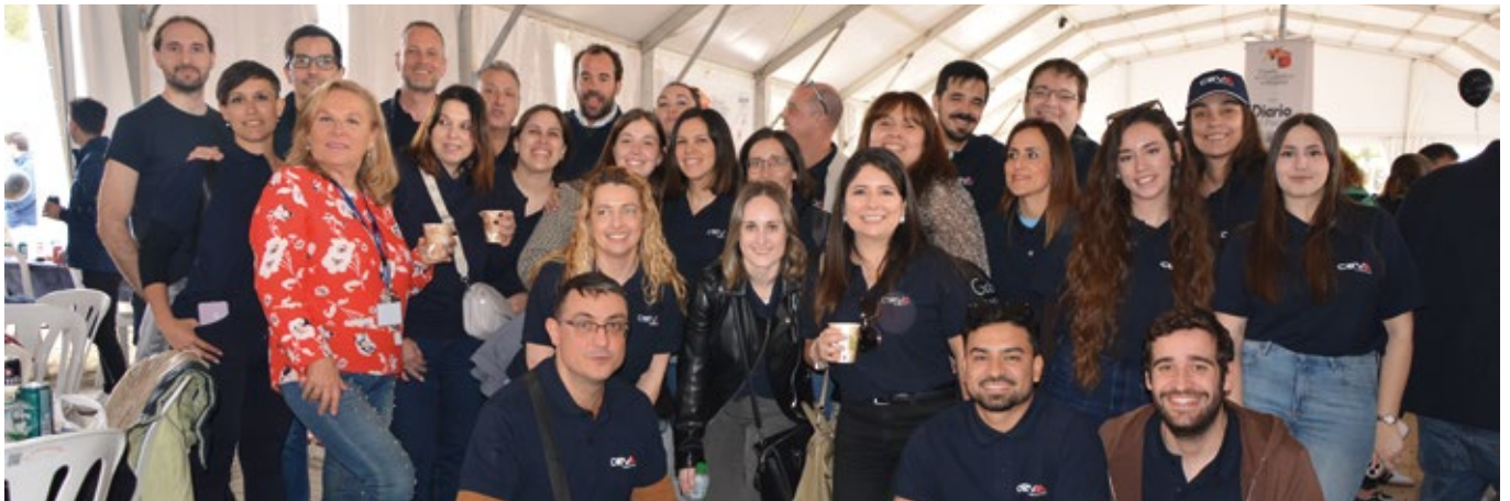
CEVA AIR & OCEAN - CEVA LOGISTICS.