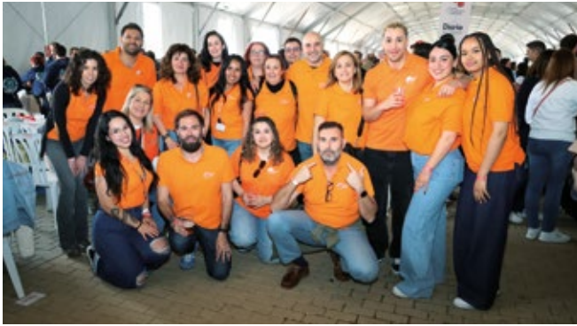
ISS GLOBAL FORWARDING SPAIN.