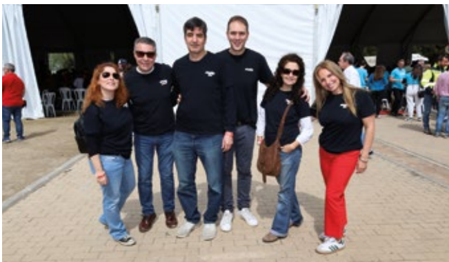
GLOBAL AVIATION SERVICES CARGO.