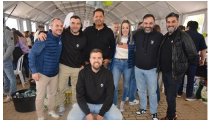
WORLD TRANSPORT SOLUTIONS & LOGISTICS.