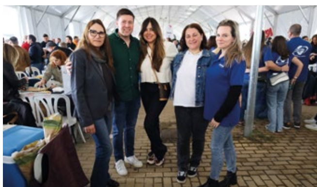
NATIONAL AIR CARGO LOGISTICS SPAIN.