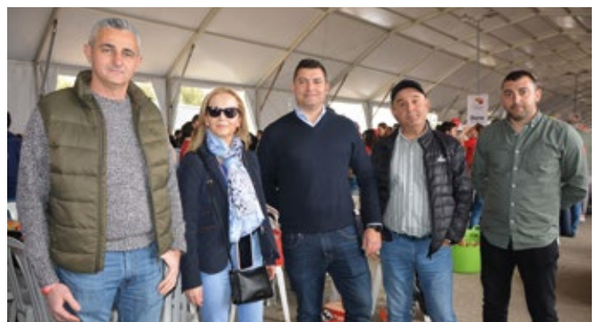
PUERTO SECO AZUQUECA.