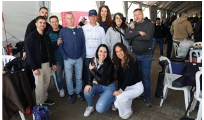
ECS GROUP SPAIN (GENAIR & AEROCARGO).