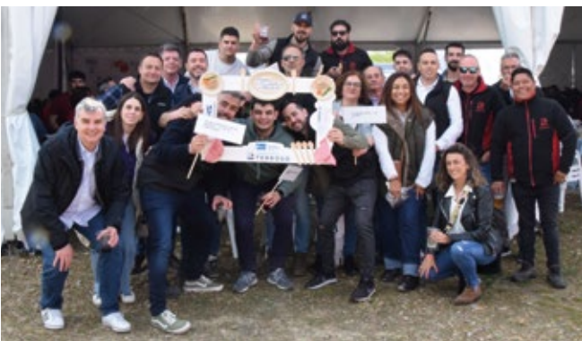
WHS, TRANSPORTES TERROSO, FRJ ROADWAY Y ERSHIP.