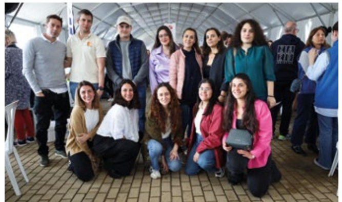
CENTRO ESPAÑOL DE LOGÍSTICA (CEL).