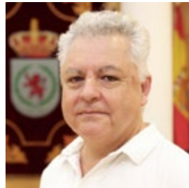
FERNANDO ROMERO CONCEJAL DE EMPLEO Y TRANSPORTES DEL AYUNTAMIENTO DE COSLADA