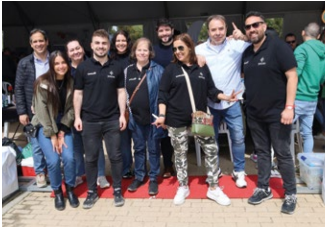
TRANSCOMA GLOBAL LOGISTICS.