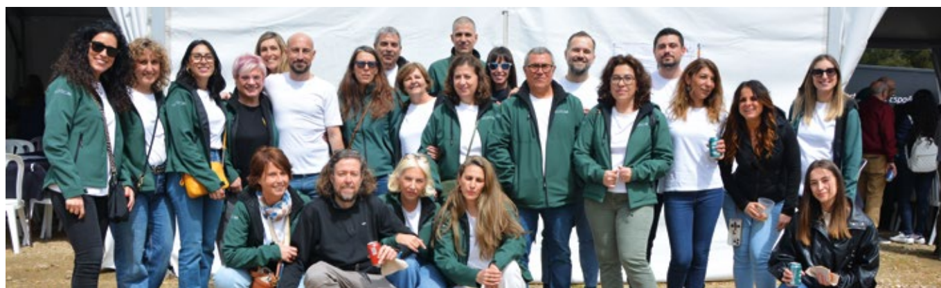
MOTION GLOBAL LOGISTICS.