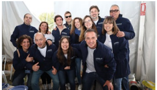
RHENUS AIR & OCEAN.