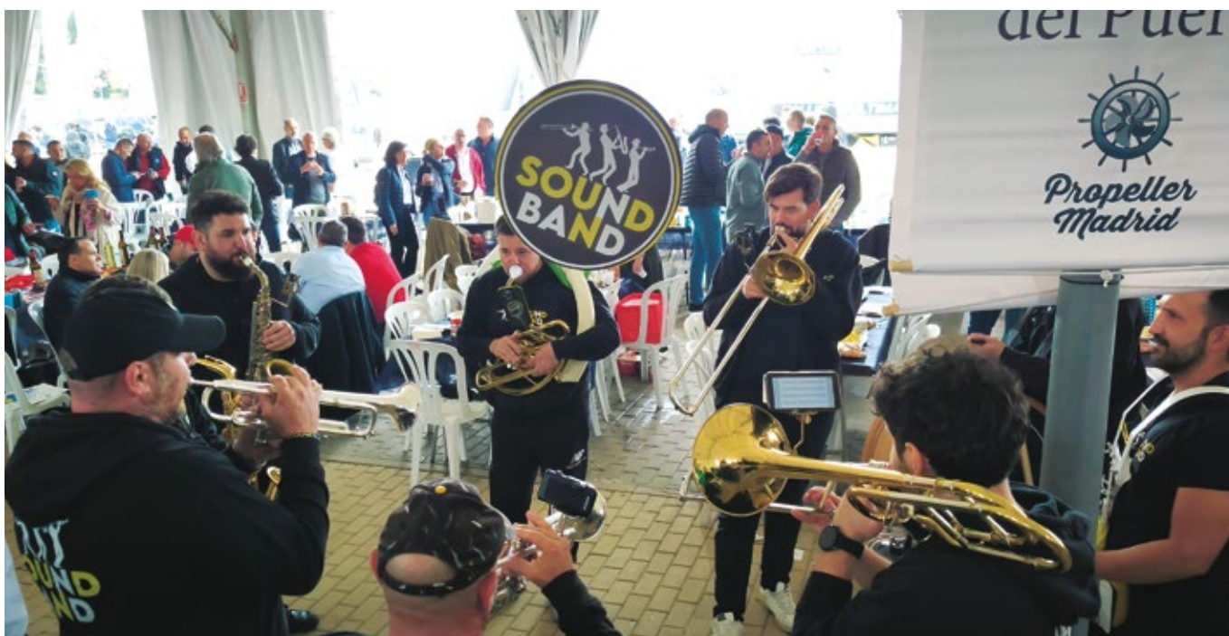
La Charanga "Sound Band" animó la fiesta del pasado año.

de premios y la participación del equipo de fútbol americano "Camioneros de Coslada" fueron otros de los alicientes de un evento que culminó con el deseo generalizado de repetir la experiencia.