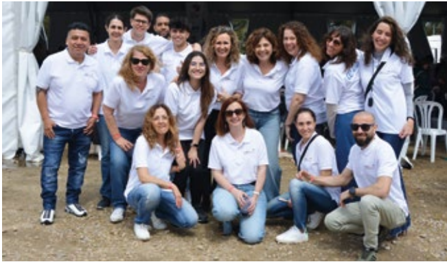
AIR EUROPA CARGO.