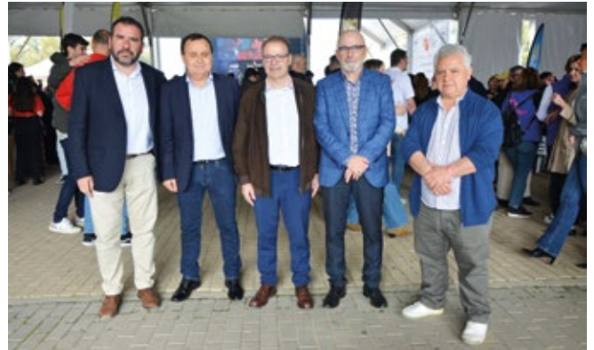
AYUNTAMIENTO DE COSLADA.