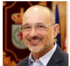
FRANCISCO BEZERRA PORTAVOZ DEL PP EN EL AYUNTAMIENTO DE COSLADA