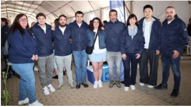
COSCO SHIPPING LINES (SPAIN).