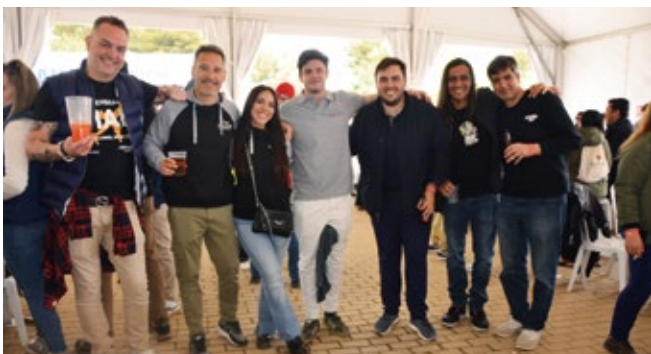
KALES AIRLINE SERVICES.