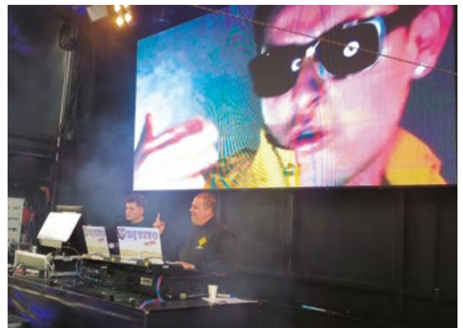
La edición 2025 de la Fiesta de la Logística de Madrid contó con la actuación del DJ Tito.