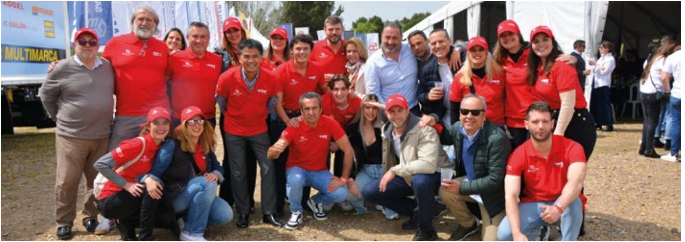
GRUPO PÉREZ Y CÍA.-MPG.