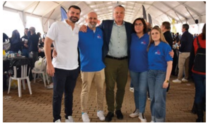
FIVE STAR GLOBAL LOGISTICS.