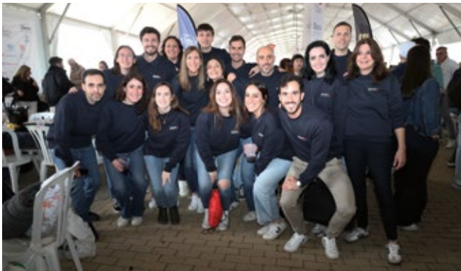
MIMPO GLOBAL LOGISTICS.