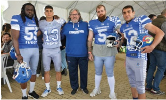
CAMIONEROS DE COSLADA.