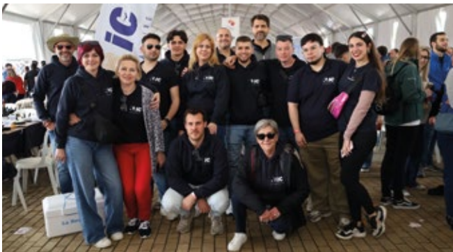
IC FORWARDING - IBERCONDOR.