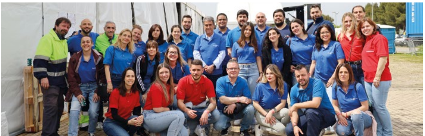
BLUE CARGO - LODIMAR.