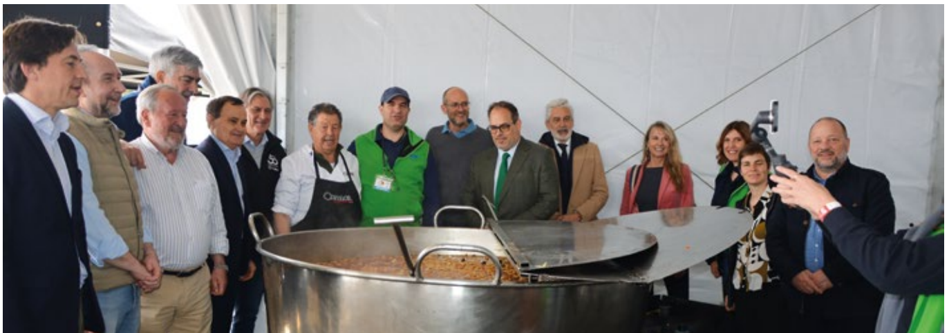
El cocido volvió a ser el contundente sello de identidad de la Fiesta de la Logística de Madrid del pasado año.

Además, confirmando su consolidación en el calendario logístico, la gran fiesta logística superará mañana el éxito alcanzado en la edición del año pasado ya que está previsto que participen más de 3.000 profesionales del sector. Así, año tras año, edición tras edición, el evento es ya una cita irremplazable.