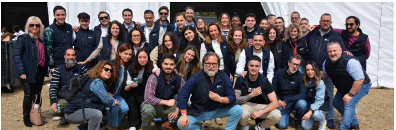
ALTAIR CONSULTORES LOGÍSTICOS.