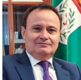
ÁNGEL VIVEROS ALCALDE DE COSLADA