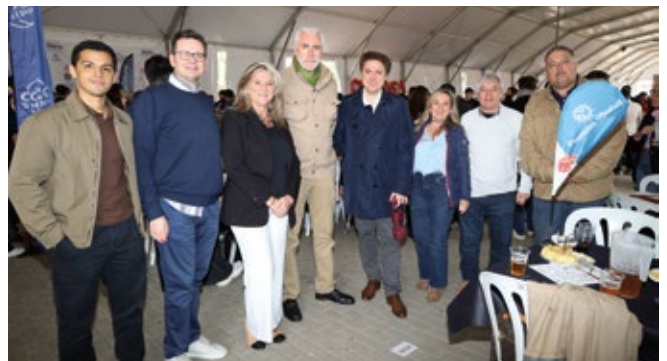
PROPELLER MADRID - PROPELLER CLUB JUNIOR DE MADRID.