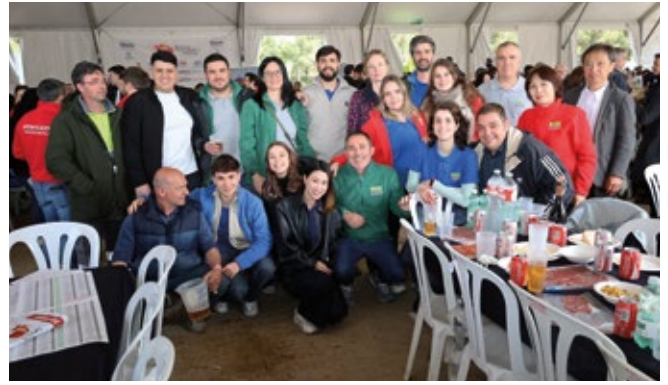
NIPPON EXPRESS DE ESPAÑA.