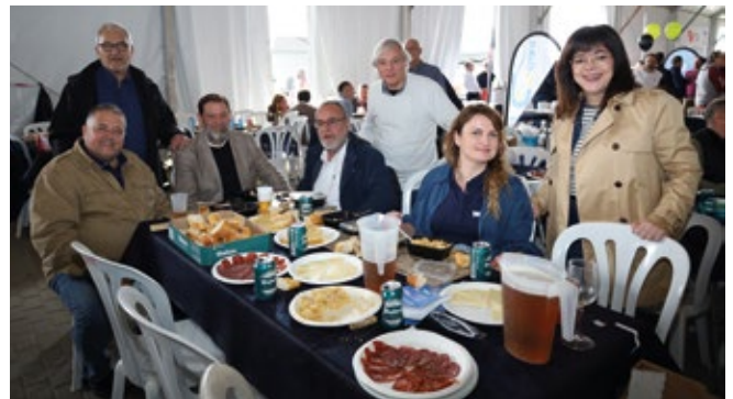
IC MARITIME SERVICES.